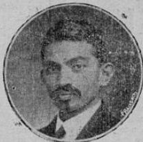
MATHAMA GANDHI El iluminado de la Libertad de la India

CIUDAD VATICANO, 5. — Los decretos finales aprobando la canonización del cardenal Roberto Bellarmino y la beatificación de Paola Frassinetti fueron leídos en presencia del Papa, terminando así el proceso necesario para autorizar que se rinda culto a ambos.