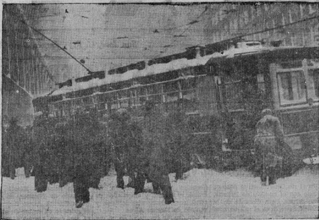
EL MEJOR PREVENTIVO