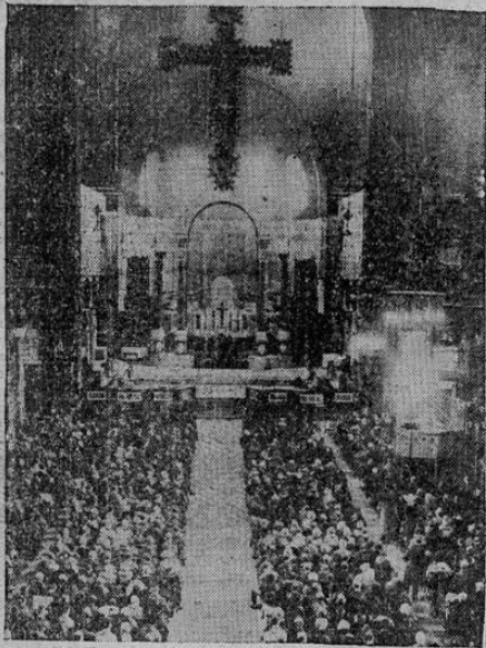
La foto muestra un aspecto de la iglesia de San Pedro, en Roma, durante la rogativa por los cristianos rusos, llevada a cabo por especial petición del Papa

Hoy fué enterrada, después de tomarse las precauciones del caso para poder sacar el cadáver de la casa del radio sin que ofreciera peligros de propagación de la enfermedad.